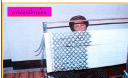
การมัดหมี่กนกบอล